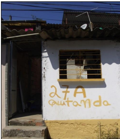
IMAGEM 1 – Fachada da quitanda de Laura