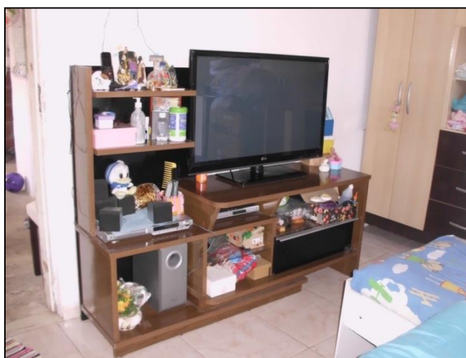
IMAGEM 4 – Móvel do quarto de Laura