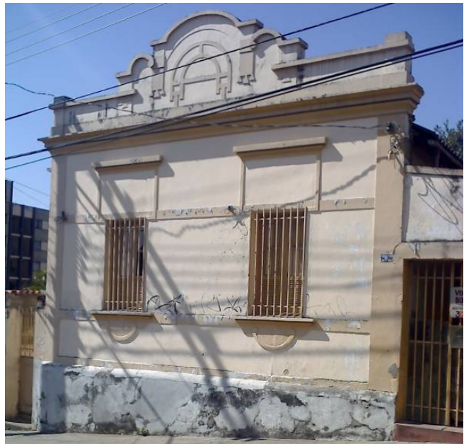
Imóvel no bairro Lagoinha, Belo Horizonte, apresenta uma sobreposição de elementos adquiridos ao longo de sua vida útil. Detalhe para referência ao antigo vão da janela, e a inserção de grades como opção de segurança do proprietário.

Escolhas individuais determinam o que se altera e o que permanece dos edifícios, do espaço urbano. Novos cenários surgem a todo instante a partir de pequenas modificações de cada elemento que compõe a paisagem: Janelas, portas, telhados, jardins, grades, calçadas, volumes e vazios do construído. E com cada ato, cada decisão individual, a morfologia urbana e as imagens do lugar vão se transformando.