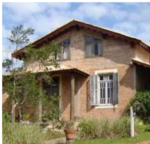
Casa construída com materiais de demolição

Nesta última situação podemos observar como o consumo do patrimônio cultural vem adquirindo para esta faixa de renda um caráter de fetiche , diferenciado, único. Trata-se do consumo deste capital simbólico, que tem adquirido um valor comercial alto. A espetacularização 22 do que há de excepcional no ambiente urbano tem sido realmente o grande objeto de consumo dos centros históricos para quem pode pagar.