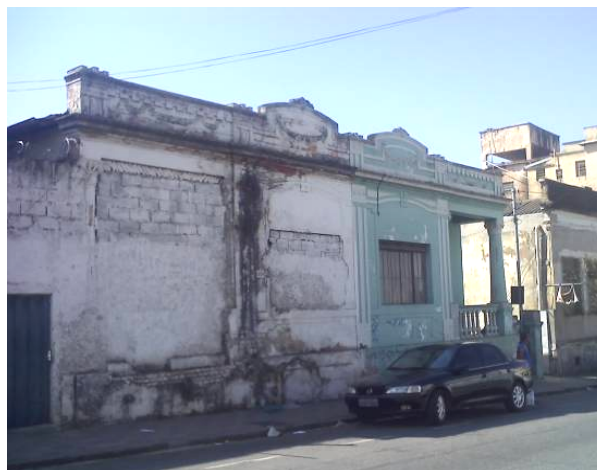
Imóvel no bairro Lagoinha, Belo Horizonte, apresenta vãos tapados, adornos retirados, esquadrias trocadas, má conservação do revestimento.

O consumo de tantos materiais padronizados sabota a percepção das especificidades de cada paisagem urbana, onde são ocultados os diversos tempos da cidade que estavam impressos em cada elemento singular que fora substituído. Os padrões repetidos pelas indústrias, que especialmente após a segunda guerra passaram a ser difundidos mundialmente, alteraram-se substancialmente quanto ao mercado a ser atendido, o elitizado e o popular.