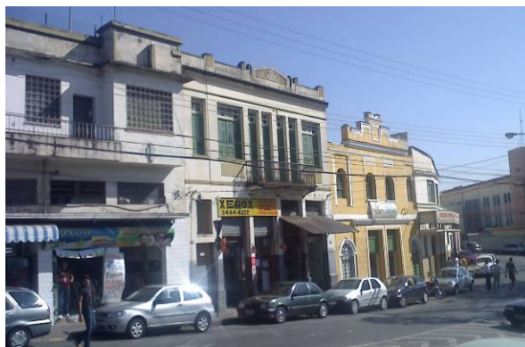
Vista da rua Itapecerica, no bairro Lagoinha, Belo Horizonte, Com edifícios de diversas épocas ocupados pelo comércio de bairro tradicional.

A cidade, como vimos, nunca é absolutamente sincrônica: o tecido urbano, o comportamento dos cidadãos, as políticas de planificação urbanística, econômica ou social desenvolvem-se segundo cronologias diferentes. Mas, ao mesmo tempo, a cidade está inteira no presente. Ou melhor, ela é inteiramente presentificada por atores sociais nos quais se apóia toda a carga temporal. 38