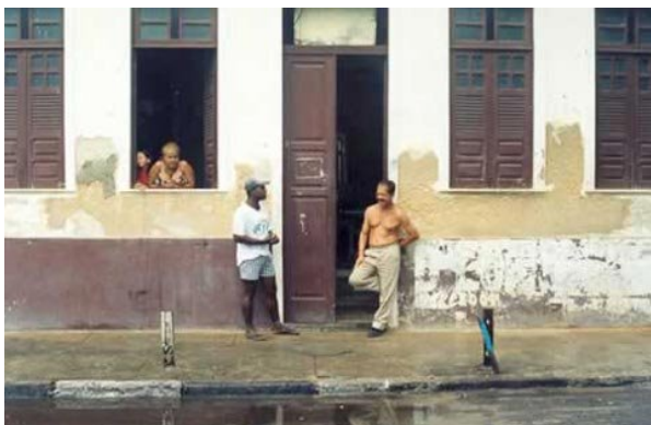
Vista de imóvel e moradores do bairro da Federação em Salvador

Há muita gente que acha que a tradição morreu com o advento da modernidade, mas, o que podemos observar com a difusão da comunicação na era global é uma tradição que ressurge com vontade de se vincular ao futuro. Esta não é mais concebida como algo distante e separado, em um tempo longínquo, mas como uma espécie de linha contínua que envolve o passado e futuro, através de ações, escolhas, e opções de como fazer esta transmissão aqui, agora no presente.