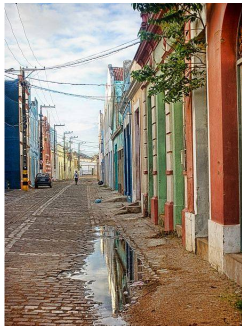
Vista da paisagem da rua Chile, bairro da Ribeira, em Natal. Opção dos proprietários e locatários pela cor nas fachadas.

Na percepção do espaço, o lugar urbano do particular e do coletivo é interpretado, como um símbolo que se vê e o que se sente. Experiência esta que é julgada pela mente, onde em primeiro lugar é feita a distinção entre a novidade e o que já é conhecido. Especialmente através da imagem as sensações são despertadas, e estas por sua vez estimulam a troca entre o cidadão e o espaço fruído que despertou aquelas sensações. E essa interação do homem que reconstrói a imagem por sua vez é reassimilada por ele e pelos demais indivíduos que compartilham daquele espaço da cidade.