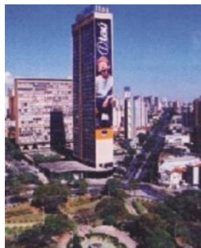
Edifício residencial JK, 1951- Belo Horizonte.

Esse consumo expresso na morfologia urbana reflete este modo de vida ansiado pelo indivíduo que busca a novidade, a independência, podendo ser observado desde a difusão das tipologias dos altos edifícios espigões que abrigam inúmeras famílias que nem se conhecem, quanto no uso de determinados artefatos da construção civil que simbolicamente estão associados aos avanços tecnológicos desta indústria, sob o ponto de vista funcional ou estético, transmitindo logicamente a idéia de modernidade, de progresso.